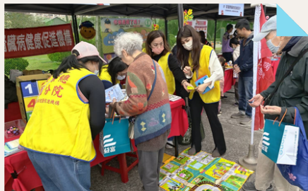
攤位設置多項互動遊戲

為響應世界腎臟日並提升民眾對慢性腎臟病防治的重視，臺北榮民總醫院桃園分院日前由腎臟科專業醫護團隊帶領，參與中華民國腎臟醫學會於國父紀念館西側廣場舉辦的年度「愛腎園遊會」，將原本較為艱澀的腎臟保健知識，轉化為趣味十足的互動體驗，吸引民眾熱情參與。