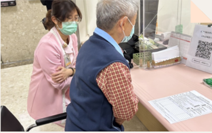
長者執行行動能力測驗

目標是幫助民眾「健康老化」，讓老年人即使身體機能逐漸改變，仍能維持自主、有尊嚴的生活。透過六大內在能力檢測，協助長者早期發現健康風險，並依評估結果提供個人化健康建議、衛教資訊與資源轉介，達到健康老化目的。