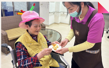
工作人員逐一將蛋糕送到每位長輩手中，吃一口甜在心間，充滿幸福滋味。

與社會參與感。未來亦將持續規劃多元活動，讓住民在安全與關懷的環境中，享有良好品質且有尊嚴的生活。