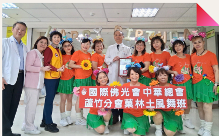
長青園護理之家與表演團體合照

臺北榮總桃園分院院長彭家勛表示，該院附設護理之家一直秉持「以愛為本、以人為尊」的照護理念，不僅提供專業照顧，更重視情感陪伴與心理支持，讓長輩感受到家人般的關心與愛護。透過慶生會結合民間團體表演活動，不僅豐富住民生活，更促進社區資源連結，提升住民情緒支持