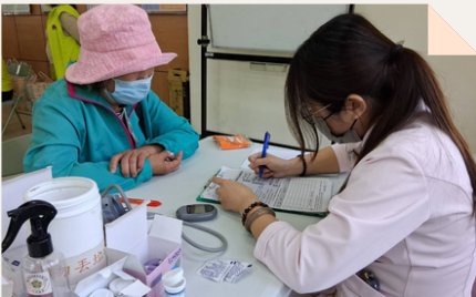
社區據點進行ICOPE評估，掌握長者六大內在能力。

ICOPE評估內容包括認知功能、行動能力、營養狀況、視力、聽力及憂鬱。其中，認知功能主要評估長者對時間、地點的定向感及短期記憶能力；行動能力則檢視是否能在12秒內完成5次起立坐下；營養狀況著重於近3個月內是否出現食慾不佳，或體重減輕達3公斤以上。此外，也會評估長者看遠、看近及閱讀等視力表現，並透過氣音測試了解雙耳聽力情