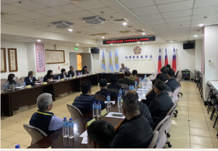
榮民服務處辦理教育訓練，提升第一線服務專業量能。

為因應高齡長者照護需求及避免獨居長者孤立無援等風險，目前各縣市榮民服務處積極推動安心御老系統平台之運用與跨機關合作。據統計，全國具中高風險之榮民達2,200人，其中桃園地區達200餘人。臺北榮民總醫院桃園分院亦積極投入，由院長彭家勛帶領成立數位科技智慧團隊，每月召開會議，進行追蹤與滾動式調整服務動向，並與榮民服務處共同拜訪桃園市政府衛生局及社會局，邀請榮民之家、慈善團體、社區鄰里長及長照機構等多元單位，共同照護具風險榮民個案，串聯各機構服務系統讓高齡長者得到適切之醫療、長照或居家服務；同時，亦持續精進相關識能，不定期地接受教育訓練，與榮民服務處狀況演練。此外，部分地區已運用安心御老平台整合服務團隊，包括社工、醫療人員、志工及村里長等角色，透過APP記錄健康資料、用藥追蹤及實地訪視，使個案管理更為精準與貼心，達到更適切的榮民照顧整合，強化跨域資源與在地服務能量。