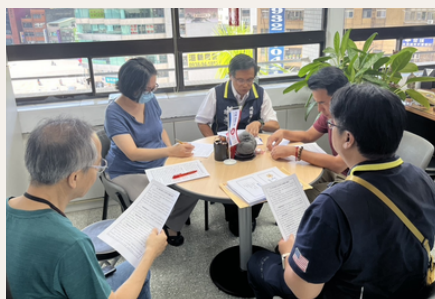
北榮桃園分院與榮民服務處共同拜訪桃園市政府社會局，強化跨機關合作機制。