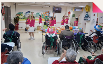
長輩們隨著節奏搖擺雙手，表演團體活力十足博得滿堂彩。