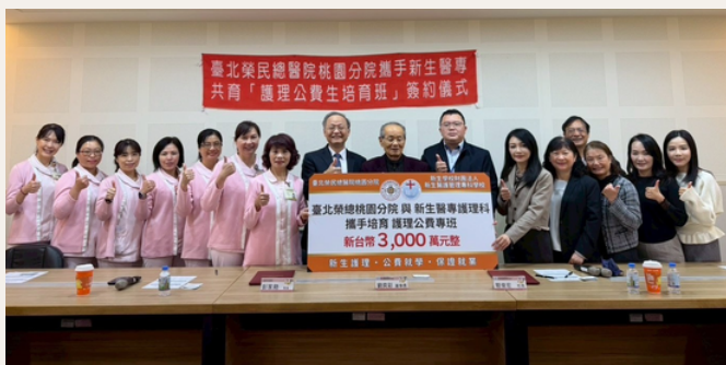
共育護理公費生培訓班成功