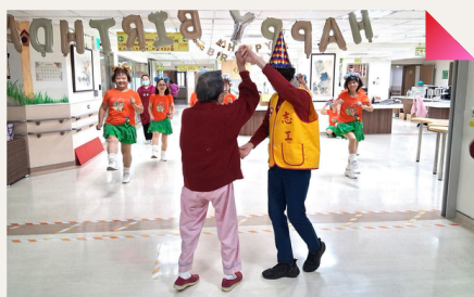
住民在工作人員陪伴下開心地站起來舞動身體

隨著醫療科技與數位教學快速發展，臨床教育模式正面臨轉型契機。為提升本院教學品質與培育具備數位应用能力之醫事人員，本院教學研究中心積極推動「數位多功能會議室」建置，並同步規劃一系列AI與沉浸式