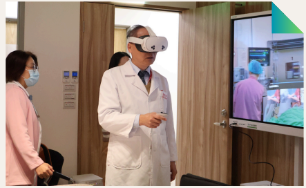
院長親自體驗沉浸式VR教學設備