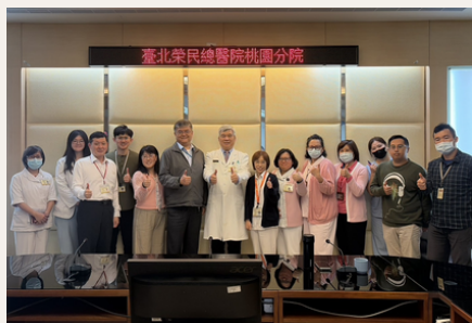
北榮桃園分院榮民數位轉型小組會議，研議智慧照護推動方向。

串接醫療、長照、社政等資源，並藉由行動APP與數位資料整合平台，使第一線服務人員、醫療團隊與家屬得以即時掌握榮民（眷）長輩之狀況與需求，落實「一點生變、多點應援」，由制度推向科技的智慧臺灣高齡照護服務理念。