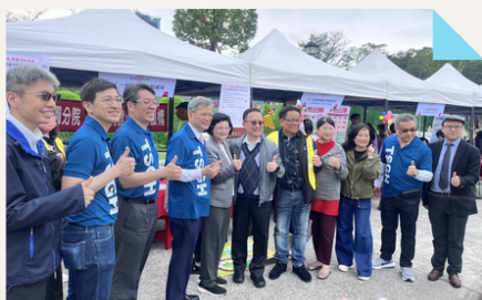
愛醫園遊會-與主辦單位貴賓合影