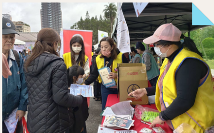
愛腎園遊會-醫護熱情參與