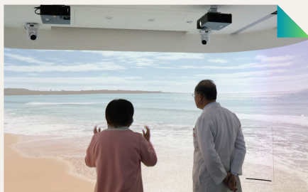
數位多功能會議室三面環景