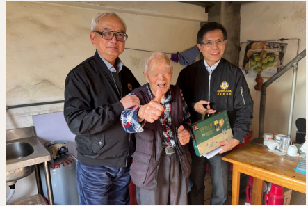
實地訪視演練，落實高風險個案照護應變能力。

此一「醫護-長照-社區服務」一體化模式，有效提升榮民（眷）醫療後續追蹤、慢性病管理與突發事件應對效率，並透過數據化監控與跨院資訊共享，使照護歷程更為無縫對接。展望未來，在持續整合政府、醫療與社福資源之下，此一模式可望逐步擴展至全民高齡照護體系，深化並普及智慧科技應用，成為因應人口老化之重要支柱。