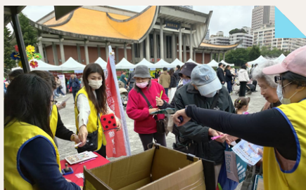
愛醫園遊會會場民眾人潮踴躍