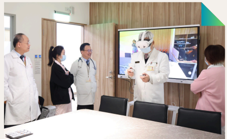
副院長親自體驗沉浸式VR教學設備

透過實作導向之訓練模式，使教師能將臨床情境轉化為沉浸式學習內容，提升學習者臨場感與操作理解，特別適用於技能訓練與情境模擬教學。