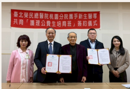
北榮桃園分院與新生醫專簽約合作意願書

透過長期且穩定的合作關係，雙方攜手培育兼具專業能力與人文關懷精神的優質護理人才，共同守護民眾健康，提升區域醫療服務品質。